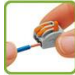
Открыть вводное отверстие клеммы поднятием рычажка и вставить проводник.