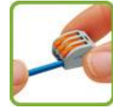
Опустить рычажок в исходное положение.