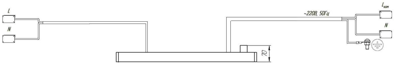
Рисунок 3. Подключение светодиодного светильника Econex Office EM оборудованного блоком аварийного питания