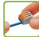
Опустить рычажок в исходное положение.