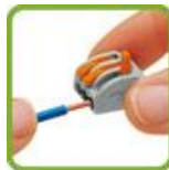
Открыть вводное отверстие клеммы поднятием рычажка и вставить проводник.