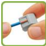
Снять изоляцию на 9-10 мм.

Подключение защитного заземления (РЕ - желто-зеленый провод) осуществляется при помощи винтового зажима, а подключение питающих проводников - фазного (L – коричневый провод) и нулевого (N – синий провод) осуществляется при помощи универсальных клемм, как показано на рисунке 3.