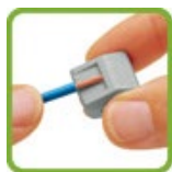
Снять изоляцию на 9-10 мм.

Подключение защитного заземления (РЕ - желто-зеленый провод) осуществляется при помощи винтового зажима, а подключение питающих проводников - фазного (L – коричневый провод) и нулевого (N – синий провод) осуществляется при помощи универсальных клемм, как показано на рисунке 3.