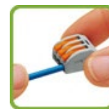
Опустить рычажок в исходное положение.