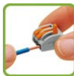
Открыть вводящее отверстие клеммы поднятием рычажка и вставить проводник.