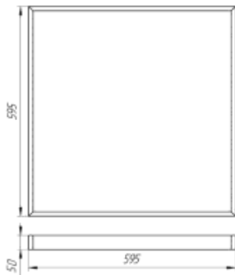
Рисунок 1. Габаритный чертеж Ecomex Office E IP54